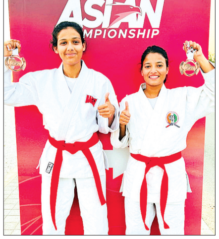
हरिभूमि न्यूज़ ►► देवास